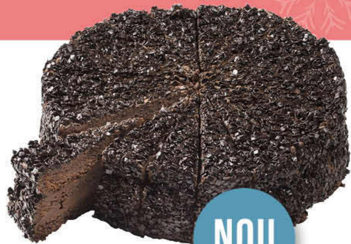
300420 PASTÍS MORT PER XOCOLATA Pastís de 2,35kg 18 racions