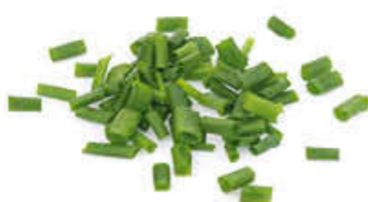
610206 PA BAO Caixa de 30 unitats de 41g