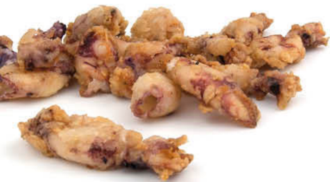
70075 PUNTILLA ENFARINADA Caixa de 2kg - Entre 100 i 200 peces per kilo