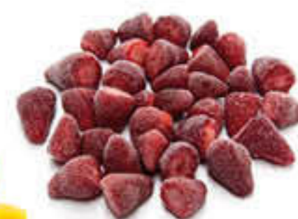
100007 MADUIXA SENCERA Bossa d'1kg