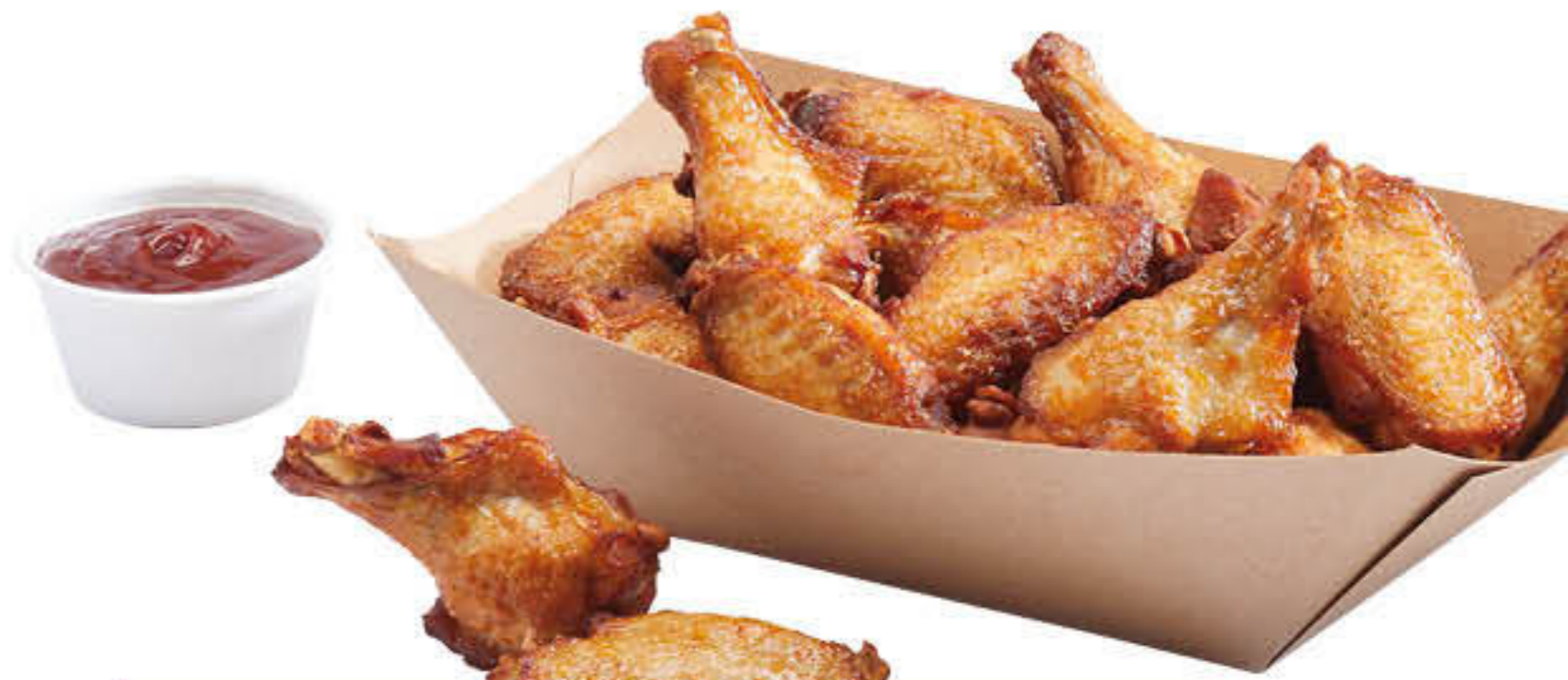
207726 CRUNCHY DE POLLASTRE Caixa de 3 bosses d'1kg ±17/25g/unitat