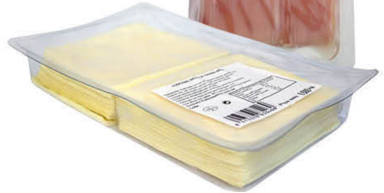
810397 FORMATGE MESCLA SANDWICH Caixa de 6 paquets de 500g