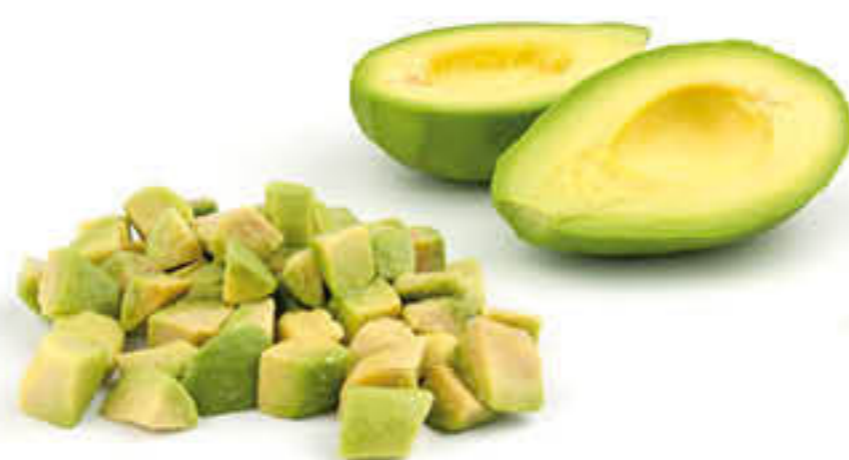
100003 ALVOCAT DAUS Bossa d'1kg

Alvocat, mango i maduixa... els complements ideals pels teus sushi rolls!!