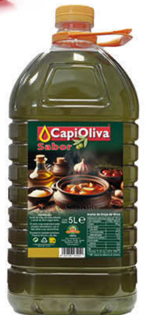
5264 OLI D'ORUJO D'OLIVA Garrafa de 5L