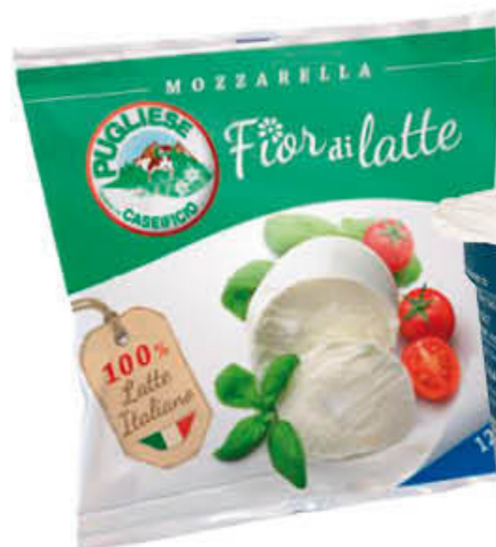
800500B MOZZARELLA FRESCA Bossa de 500g - 4 u/ bossa