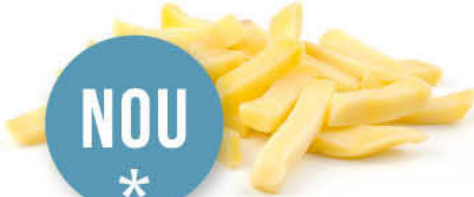
810830 PATATA BASTONS Caixa de 4 bosses de 2kg