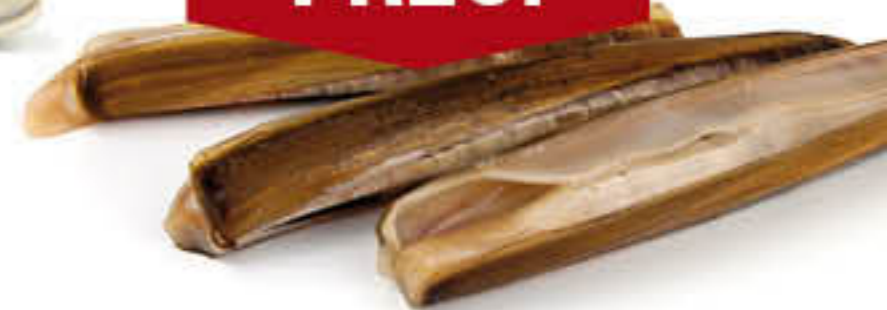
20031 NAVALLS Caixa de 5kg - Talla 8/12cm a granel - Origen: HOLANDA - FAO 27 - Ensis directus