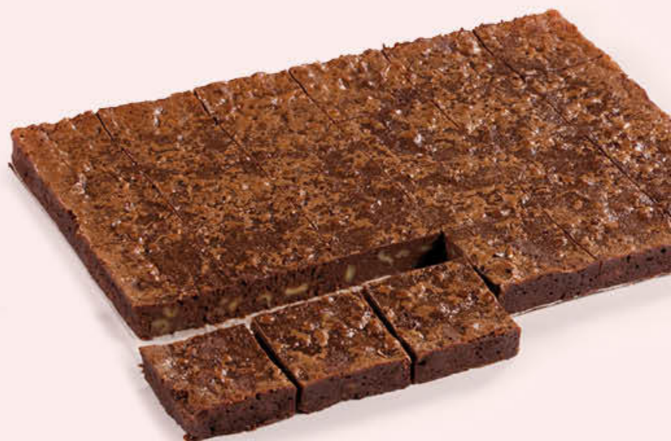
300534 PLANXA DE BROWNIE Planxa de 1,80kg - Pretallada - 24 racions