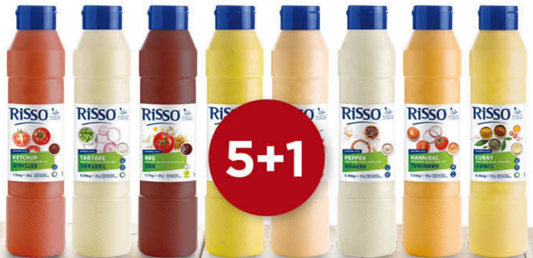
901110 SALSA KETXUP, 901113 SALSA MOSTASSA, 901112 SALSA BARBACOA, 901120 SALSA SAMURAI, 901121 SALSA PEBRE, 901122 SALSA HANNIBAL, 901123 SALSA CURRY, 901111U SALSA TÀRTARA, Ampolla d'1L

Infinitat de salses per acompanyar i donar sabor a les teves elaboracions