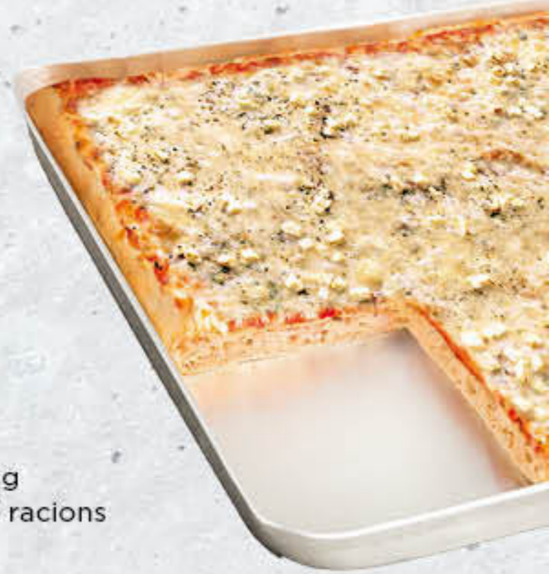
700093 PIZZA 4 FORMATGES Caixa de 4u de 965g 38x28 cm/uni - 6-8 racions