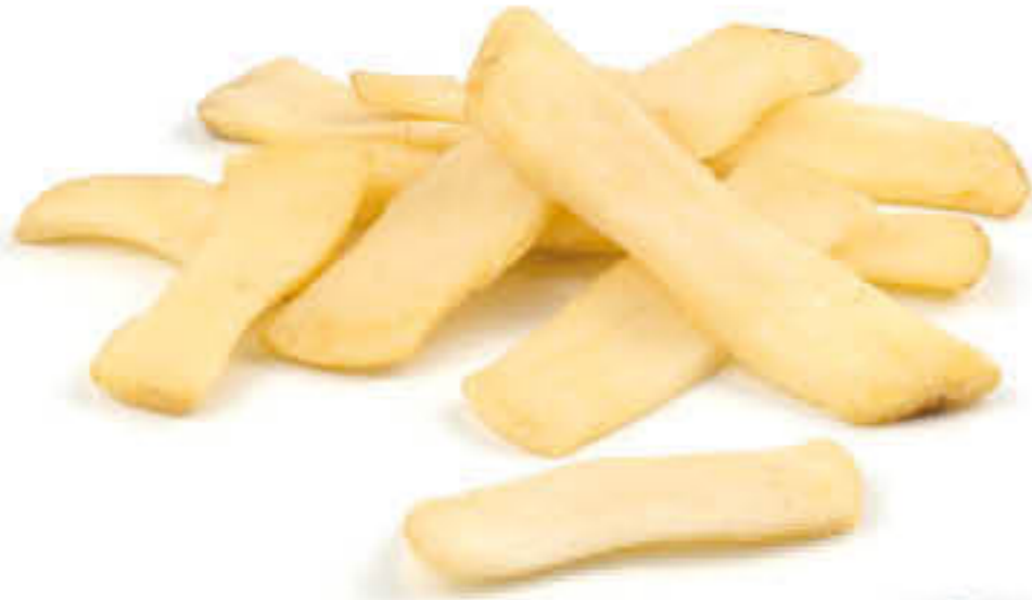
726 NATURAL WAVY FRIES Caixa de 4 bosses de 2,5kg