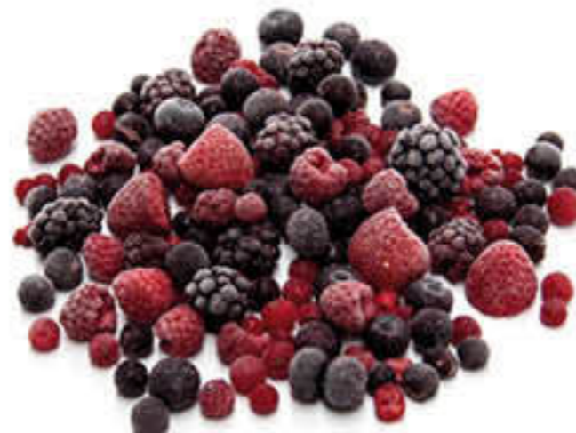
100002 FRUITES DEL BOSQ Bossa d'1kg -Ingredients: Maduixa, mora, grosella vermella, nabiu, gerd i grosella negra