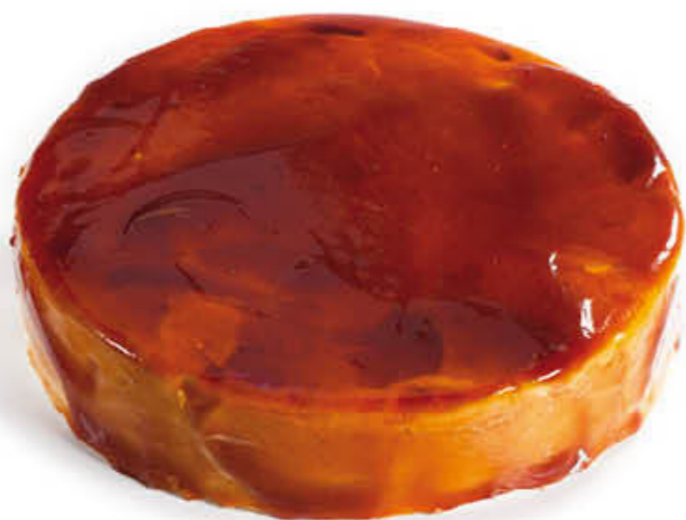
300521 PASTÍS DE GALETA I CAMEL Pastís de 1,50kg - Sense pretallar - 12/14 racions