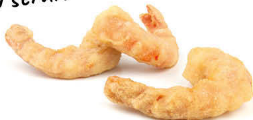
15790 LLAGOSTÍ PREMIUM TEMPURA Caixa de 2kg - 19g/u