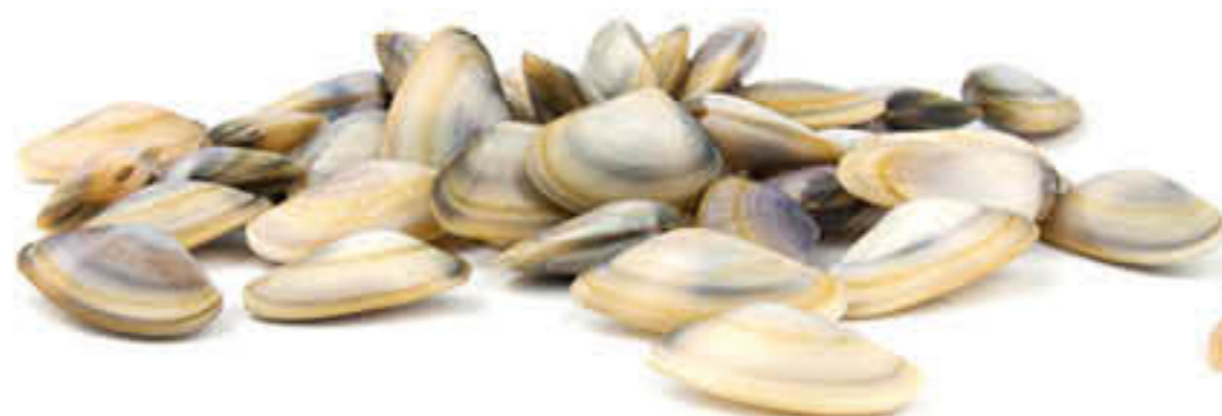
20030 COQUINA Caixa de 12 bosses de 250g - Pasteuritzada - Origen: Turquia - FAO 37.4 - Donax trunculus