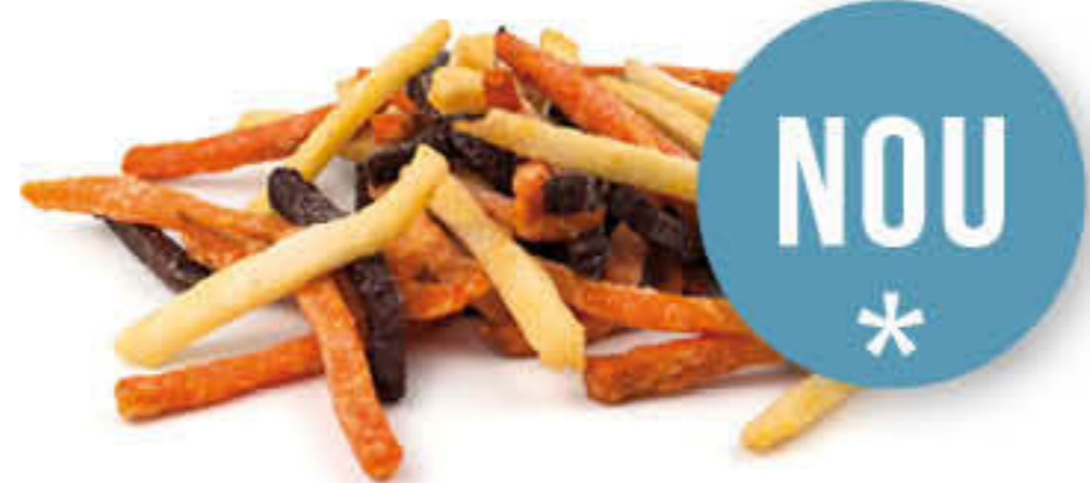
828 VEGGIE FRIES Bossa de 2,5kg - Ingredients: pastanaga, remolatxa i xirivía