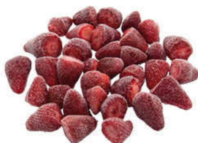
100007 MADUIXA SENCERA Bossa d'1kg