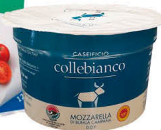
800506 MOZZARELLA DI BUFALA Caixa d'11 unitats de 125g