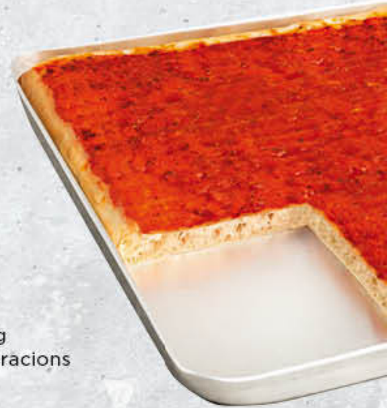
700090 PIZZA BASE DE TOMATA Caixa de 4u de 795g 38x28 cm/uni - 6-8 racions