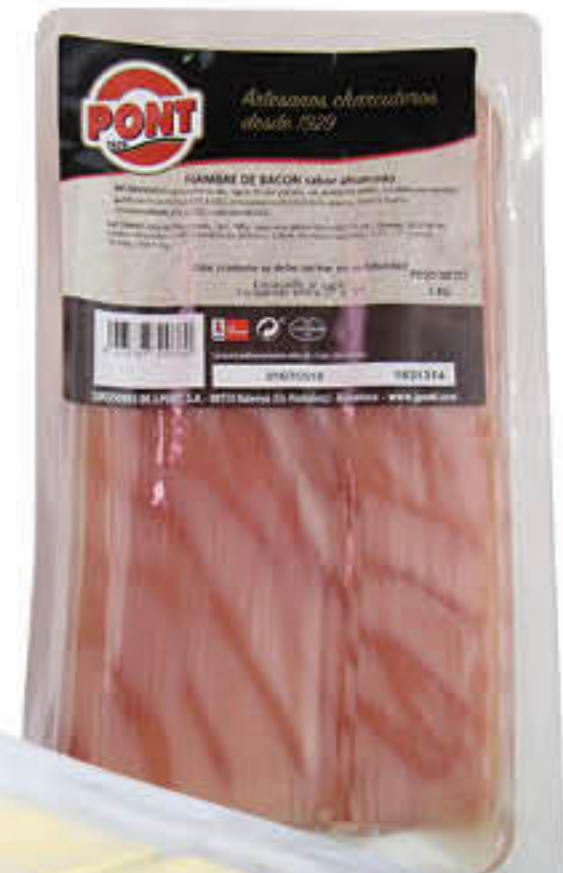
811025 FIAMBRE BACON FUMAT LLESCAT Safata d'1kg