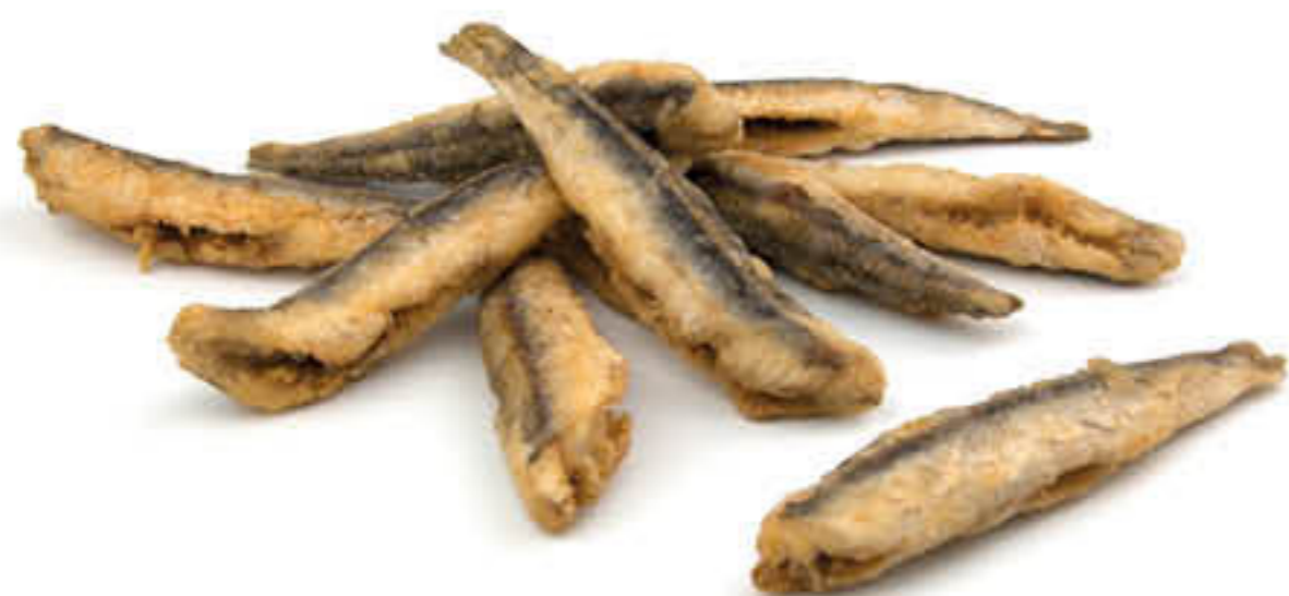
15797 SEITÓ ENFARINAT Caixa de 2kg - ± 90 peces de 110g