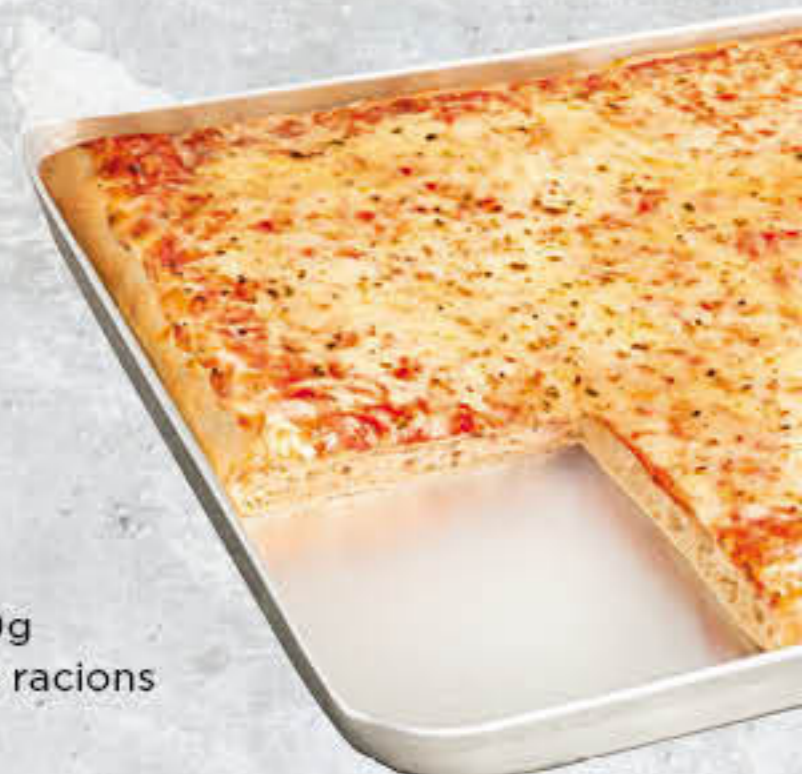
700091 PIZZA MARGARITA Caixa de 4u de 980g 38x28 cm/uni - 6-8 racions