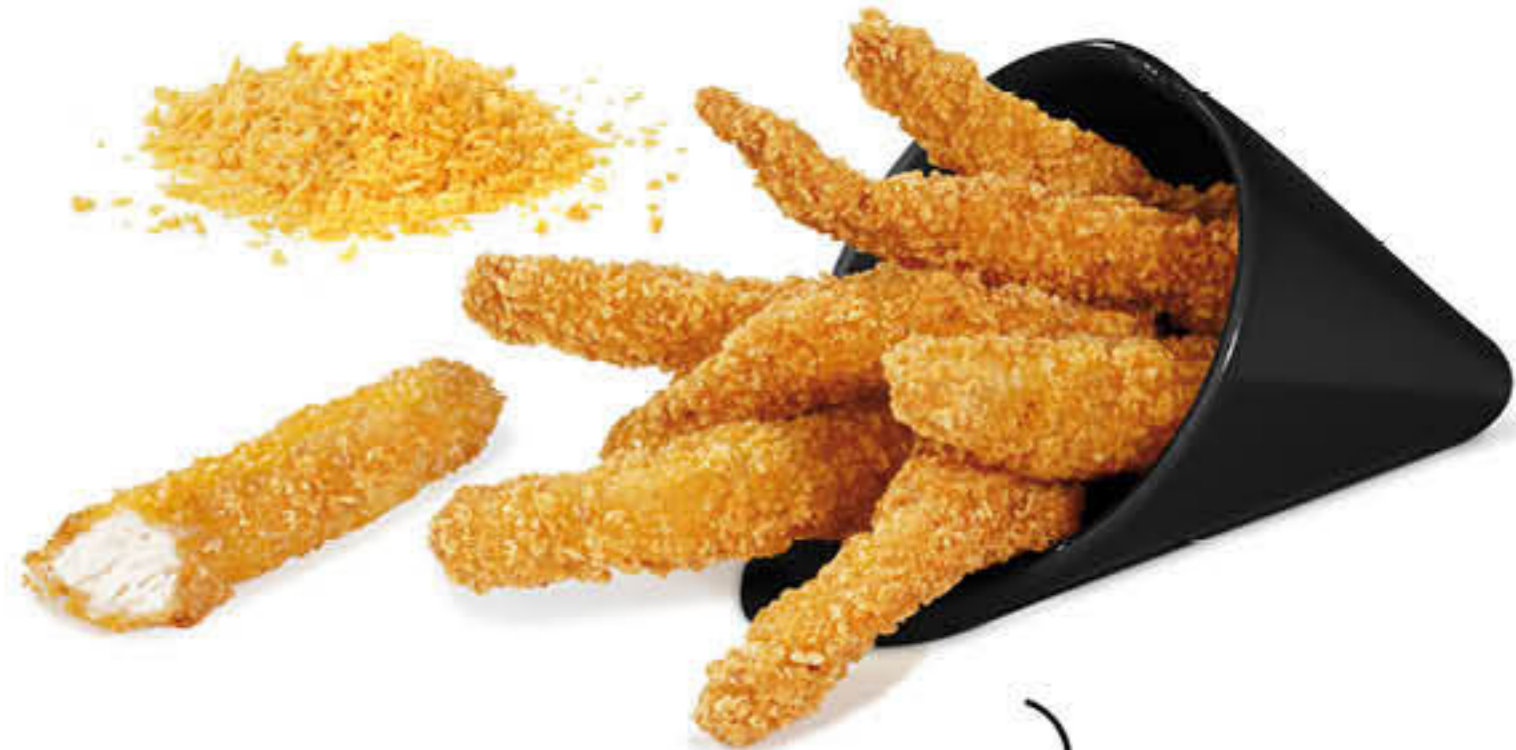
207728 TIRES POLLASTRE Caixa de 3 bosses d'1kg