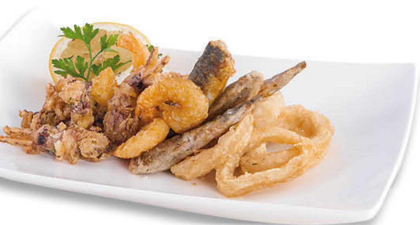
15789 FRITURA DE PEIX Caixa de 2kg - Ingredients: Peixet, musclo molla, puntilla, anella de calamar, cua de llagostí marinada, cua de gamba pelada