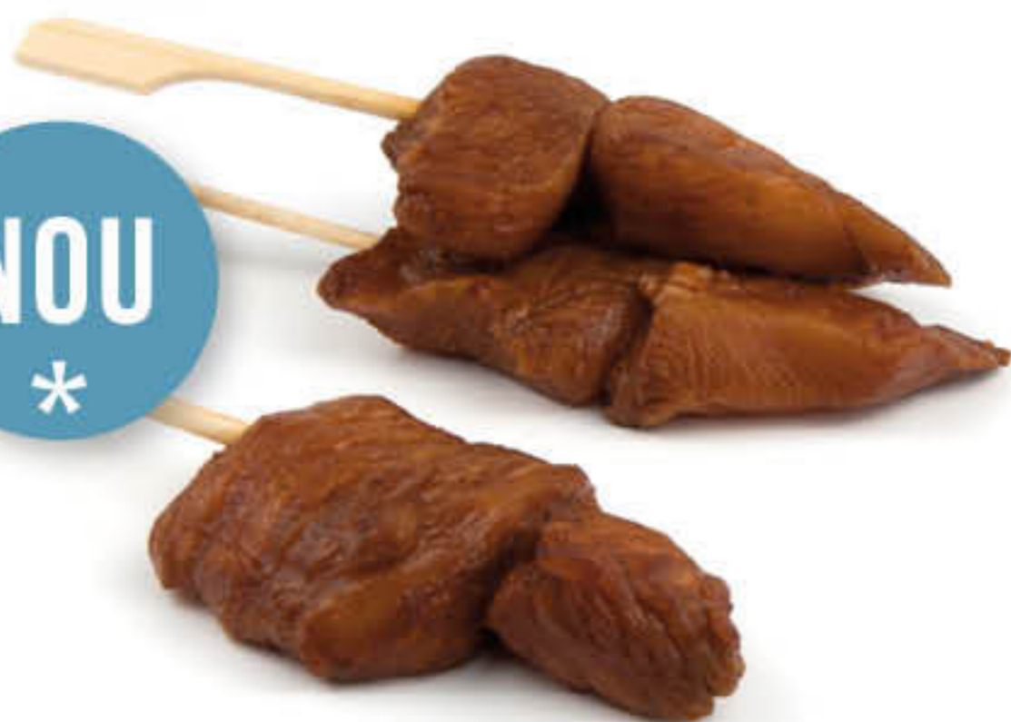
15785 BROQUETA YAKITORI Caixa d'1,5kg 50 unitats de 30gr