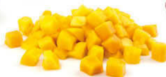
100005B MANGO DAUS Bossa d'1kg