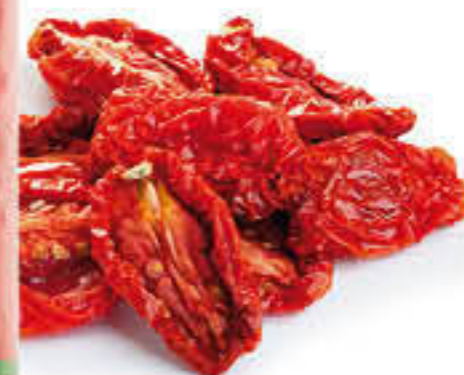
800592U TOMATES SECS Llauna de 760g