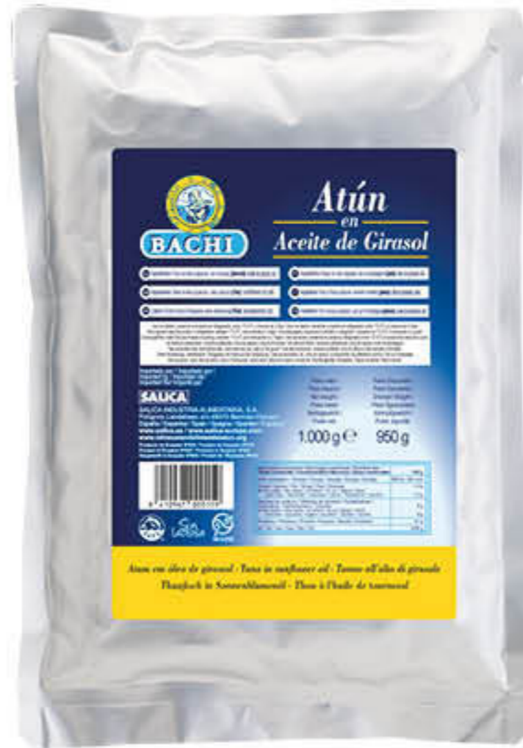
94052 TONYINA EN BOSSA Bosses d'1kg