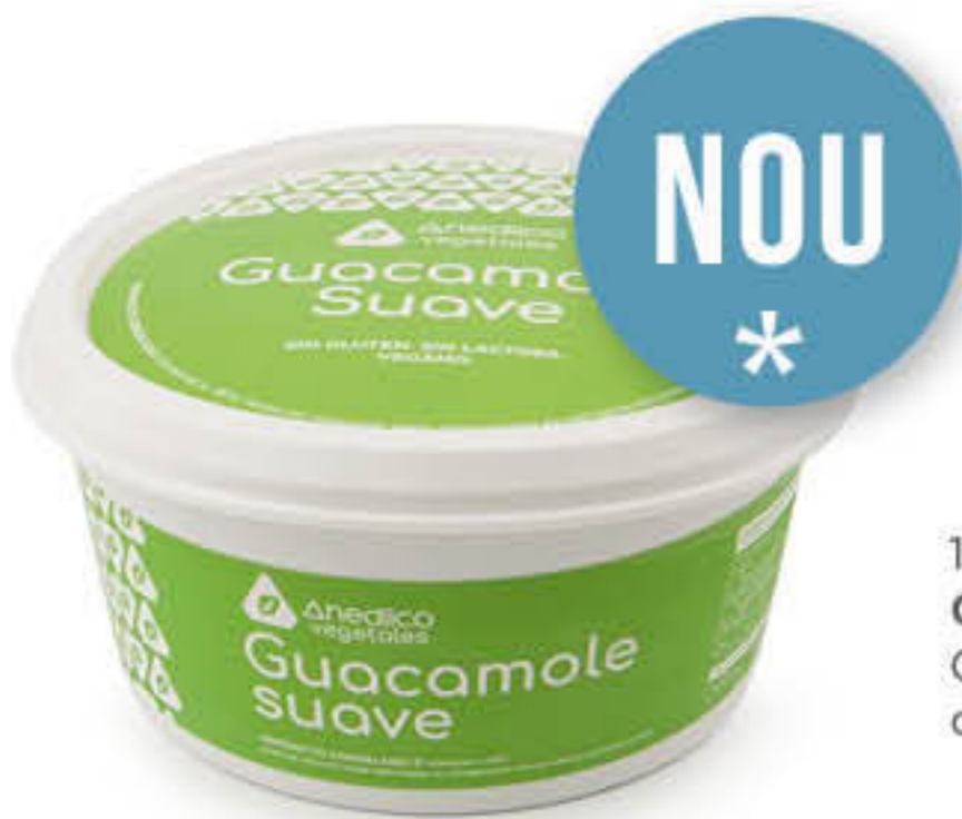
100009 GUACAMOLE SUAU Caixa de 12 unitats de 500g