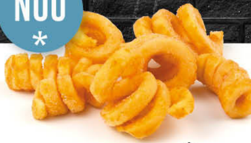
730 TWISTERS Caixa de 4 bosses de 2,5kg