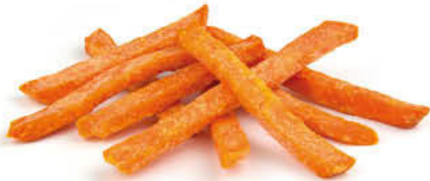
829 SWEET POTATO Bossa de 2,5kg - Tall 11/11