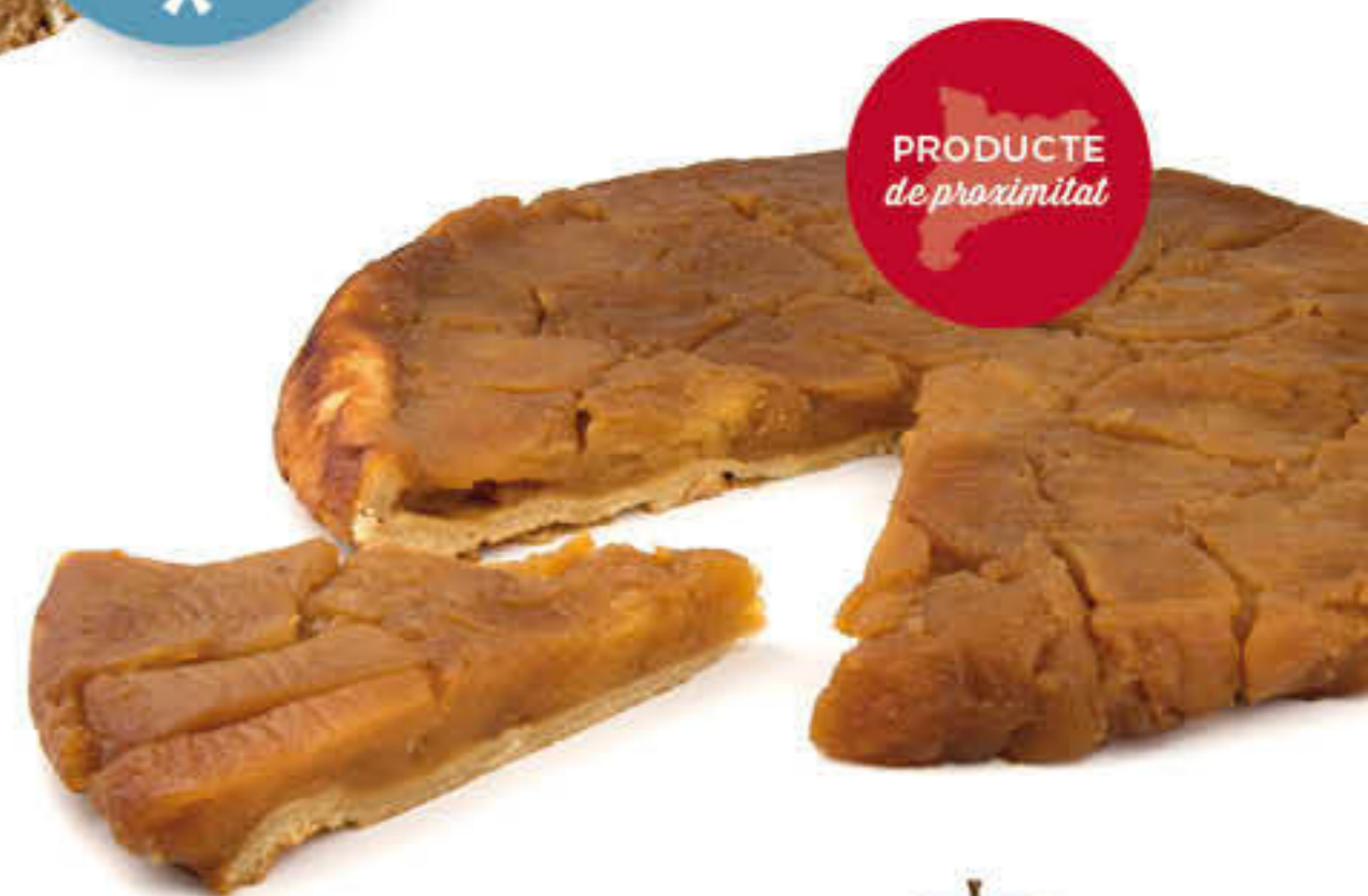
300585 TATIN DEL MOOMA Pastís de 1,70kg - 12 racions