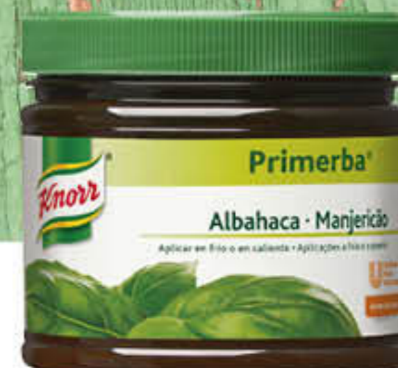
911053 PRIMERBA ALFÀBREGA Caixa de 2 unitats de 340g

Amb un mica de primerba completes la caprese