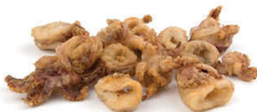
15762 XIPIRÓ ENFARINAT PREMIUM Caixa de 2kg