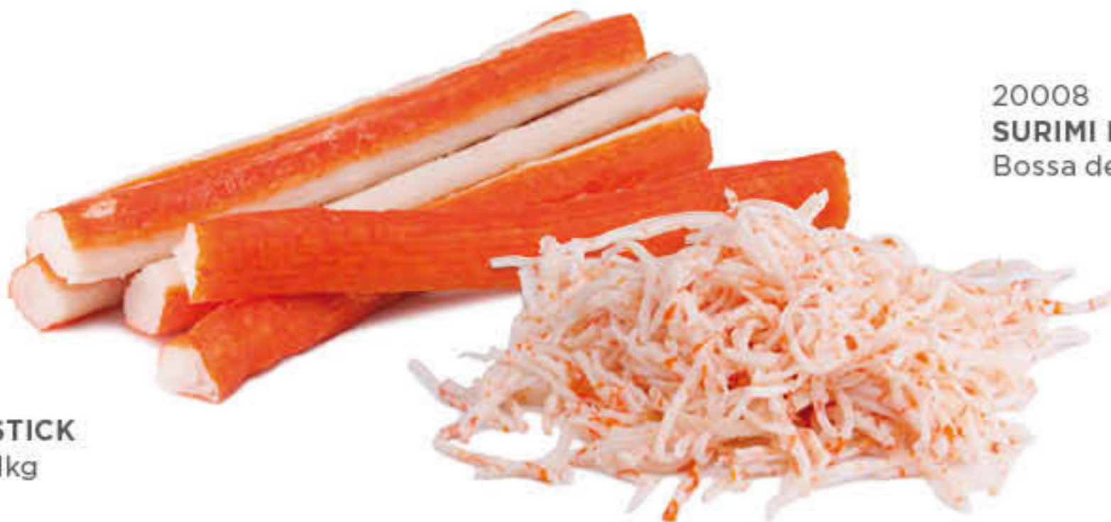
20013 SURIMI STICK Bosses d'1kg