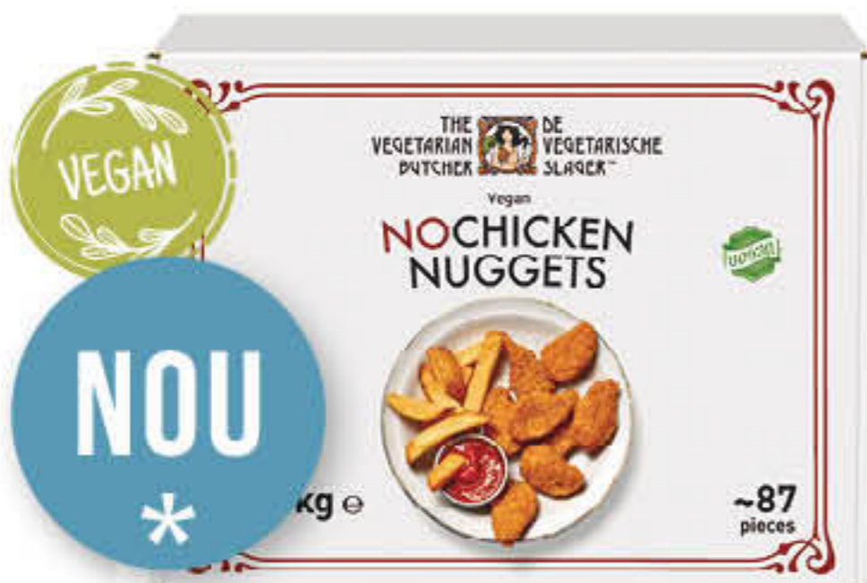
915011 TVB NUGGETS NOPOLLO VEGANS Caixa de 1,75kg (±87u de 20g)

Marinat i arrebossat a l'estil meridional