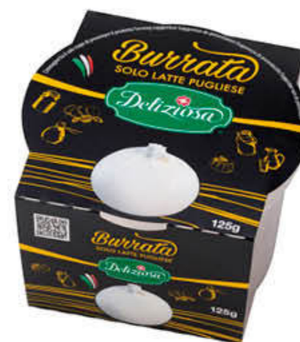
800502 BURRATINA Caixa de 8 unitats de 125g