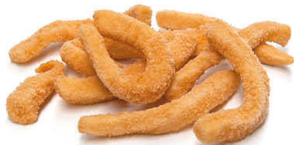
207738 RABES EMPANADES Caixa de 4 bosses d'1kg