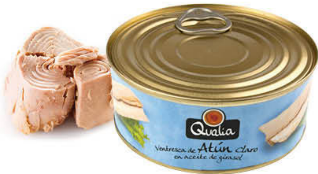
94053 VENTRESCA DE TONYINA Llauna de 900g