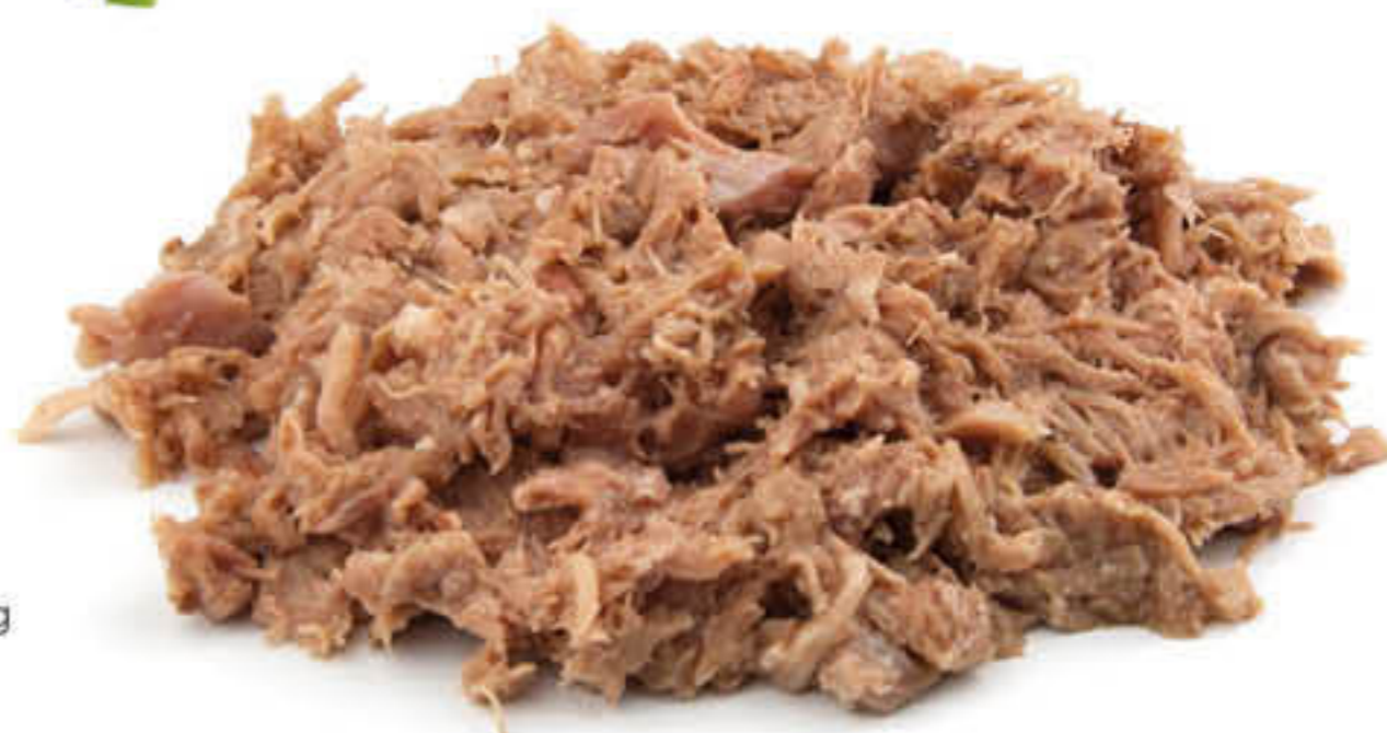
310307 PULLED PORC Caixa de 4u al buit de ±840g