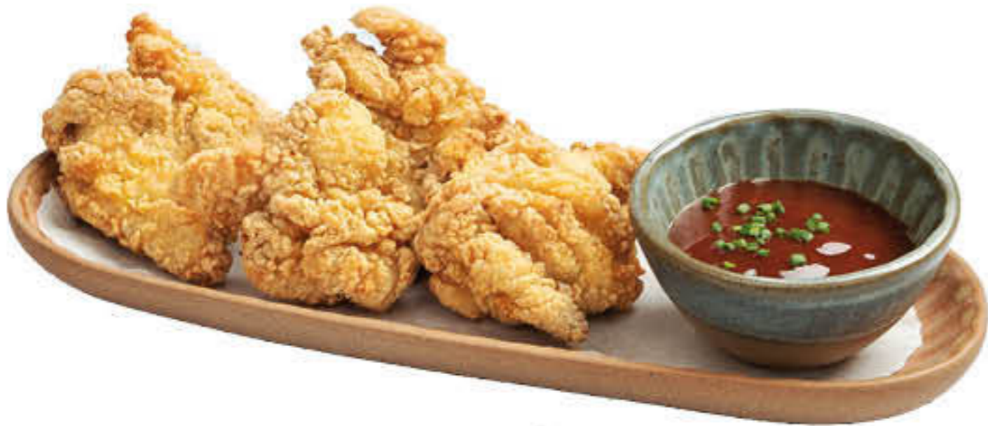
207724 POLLASTRE A L'ESTIL KENTUCKY Caixa de 3 bosses d'1kg