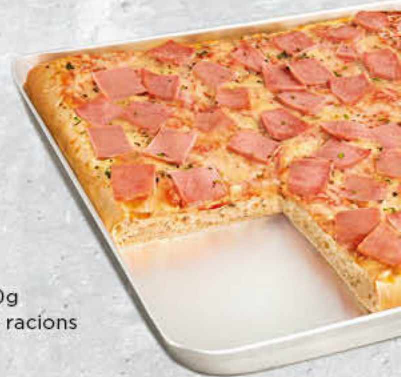
700092 PIZZA PROSCIUTTO Caixa de 4u de 1010g 38x28 cm/uni - 6-8 racions