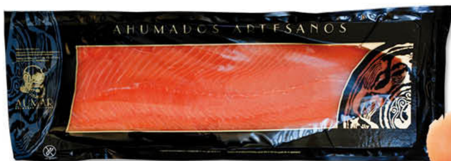
94027 SALMÓ FUMAT LLESCAT Safata de ±1,2kg