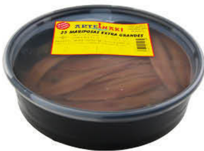
94061 ANXOVA PAPALLONA Safata de 325g - 50 filets