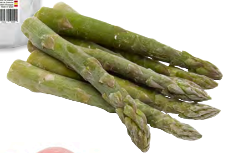
40324 ESPÀRRECS GRUIXUTS Caixa de 5 bosses d'1k