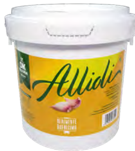
3810 ALLIOLI Galleda de 2L