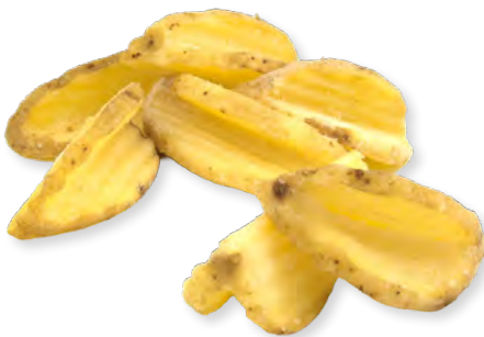
844 MCCAIN CRISPERS Caixa de 5 bosses de 2,5kg