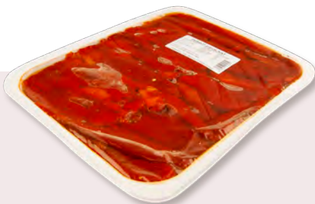
810815 PEBROT ESCALIVAT EXTRA Safata d'1kg