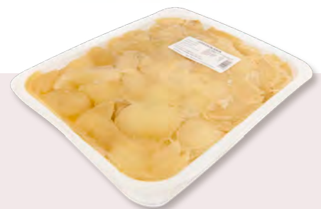
810817 CEBA ESCALIVADA Safata d'1kg