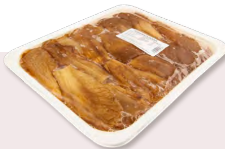
810819 ALBERGÍNIA ESCALIVADA Safata d'1kg