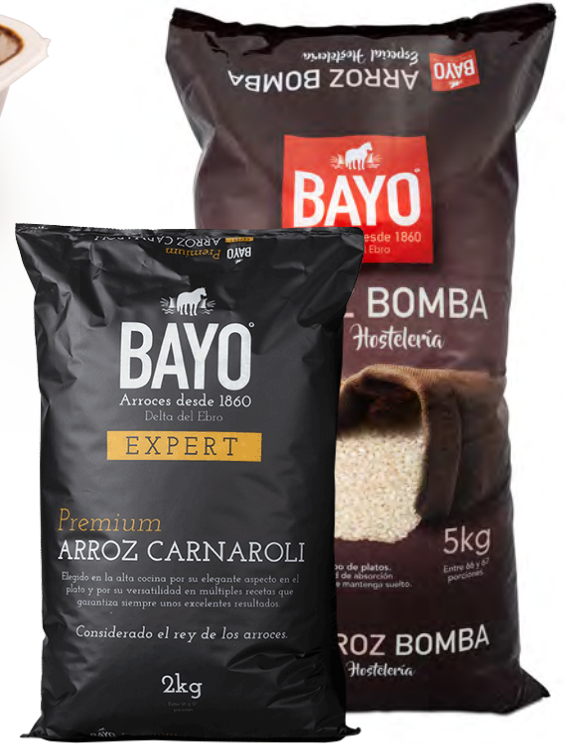
810871 ARRÒS CARNAROLI Caixa de 2u de 2kg