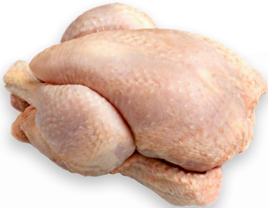
401186 PICANTON EXTRA Caixa de 15u de 300-500g