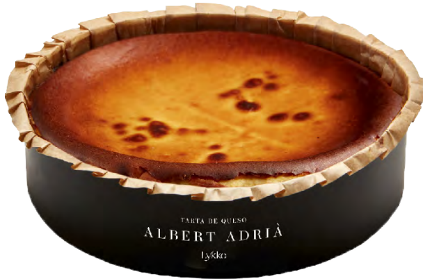
630042 PASTÍS DE FORMATGE DE L'ALBERT ADRIÀ Pastís d'1,1kg - 10/12 racions