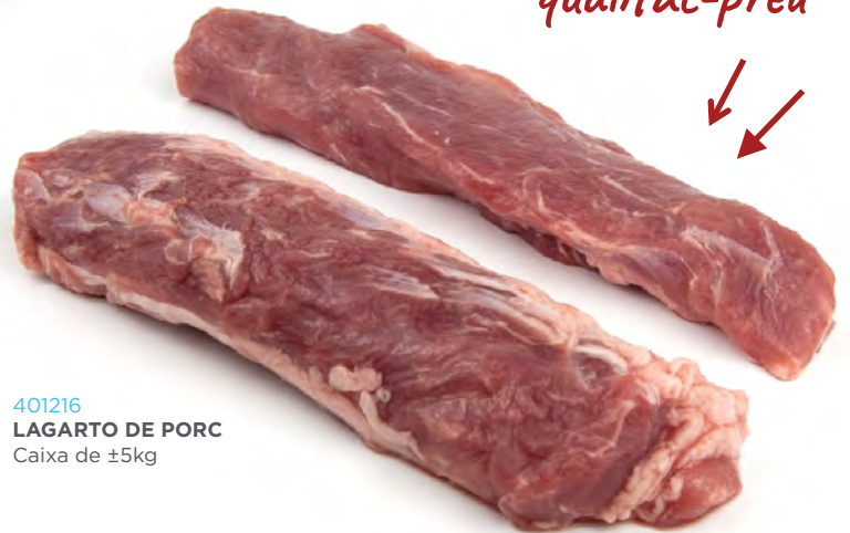
401216 LAGARTO DE PORC Caixa de ±5kg