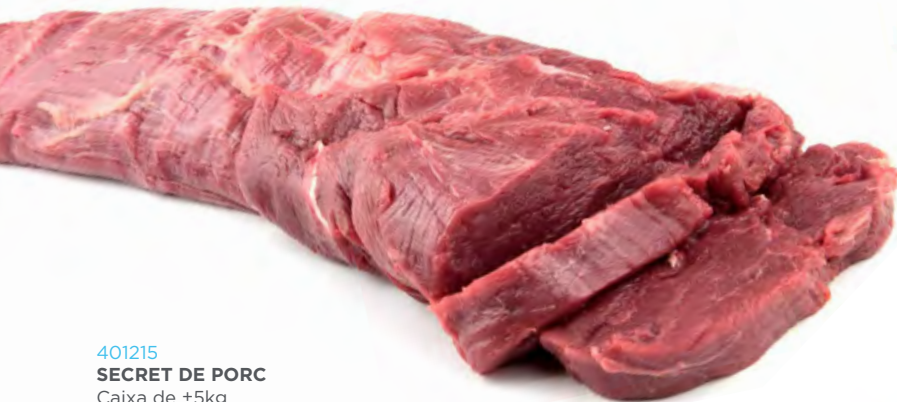
401215 SECRET DE PORC Caixa de ±5kg

Peça magra i infiltrada, amb una excel·lent relació qualitat-preu