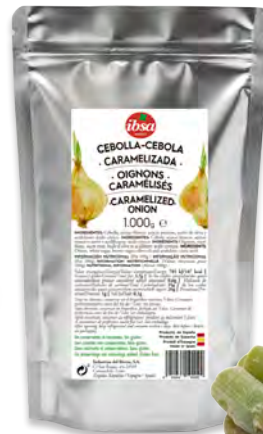
810880 CEBA CARAMEL·LITZADA Bossa d'1kg