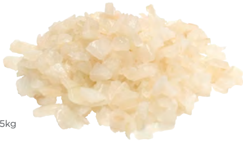
810870 ARRÒS BOMBA Bosses de 5kg