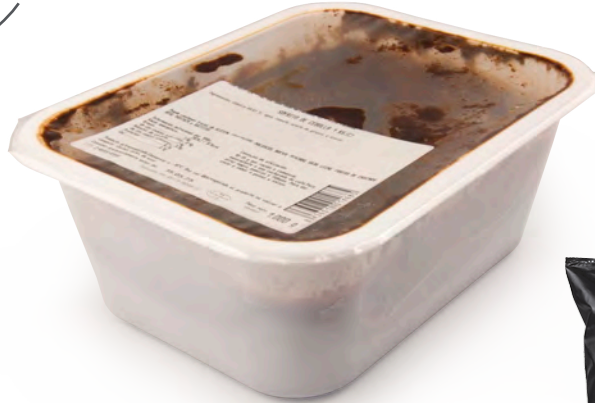
810881 SOFREGIT DE CEBA Safata d'1kg