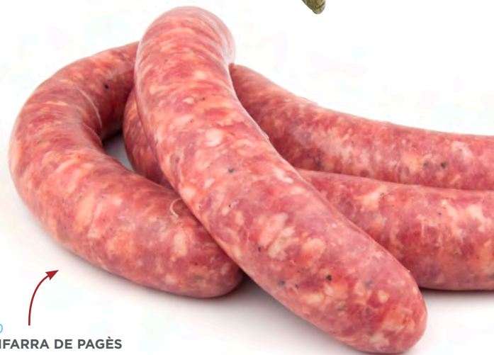
2500 BOTIFARRA DE PAGÈS Safata de ±2kg - 16u de 140g