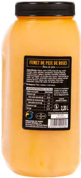
909012 FUMET DE PEIX DE ROSES Ampolla de 2,2L

Estalvia temps, controla el cost sense minves i assegura sempre el mateix resultat