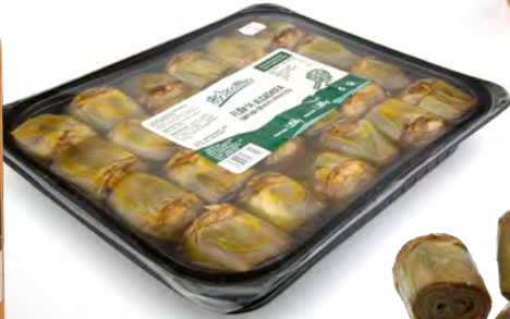
876U ESCARXOFA FLOR CONFITADA Safata de 1,4kg - 20 unitats